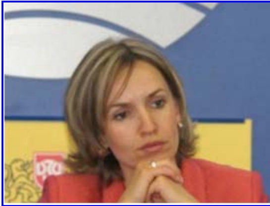
Guergana Passy, ministre des affaires européennes

- le Mouvement des libertés (MDL, en bulgare DPC), qui a la particularité d'avoir participé à toutes les majorités depuis 1990. C'est dont par essence un parti de gouvernement (un peu comme le parti radical sous la III ème république en France) que le gouvernement penche à droite ou à gauche. En 2005, il a obtenu 34 élus dans l'assemblée sortante. Il est aussi caractérisé par une stabilité de son leadership puisque c'est toujours Ahmed Dogan qui en est à la tête mais il refuse d'être cantonné au statut de parti ethnique. Son programme est axé sur la défense des droits des individus et de la promotion de l'égalité sociale. Assis sur une base ethnique et géographique solide, le MDL devrait être représenté dans le prochain parlement.